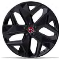
Zliatinové disky 19" MINNEAPOLIS (ZHT1) v sérii pre PERFORMANCE LINE/ PERFORMANCE LINE+