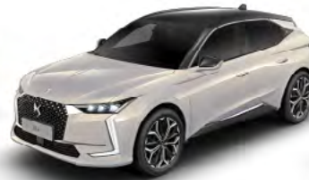
Sivá Cristal Pearl (M)