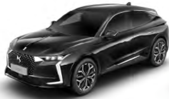
Čierna Perla Nera (M)