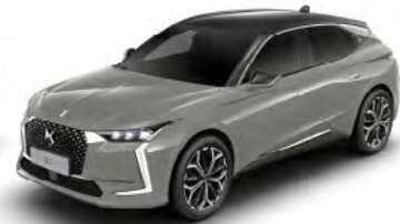
Sivá Laqué (M)