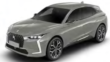
Sivá Laqué (M)