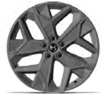
Zliatinové disky 19" SAPPORO (ZHS9) v sérii pre TROCADERO CROSS