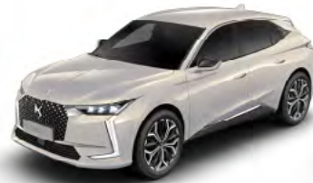
Sivá Cristal Pearl (M)