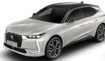
Biela Perleť (P)