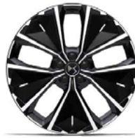
Zliatinové disky 20" SYDNEY (ZHT8) vrátane DS ACTIVE SCAN SUSPENSION , voliteľná výbava pre PureTech 225 a E-TENSE 225 (verzie PERFORMANCE LINE+ , RIVOLI, CROSS RIVOLI )