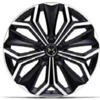
Zliatinové disky 19" SEVILLA (ZHT4) v sérii pre RIVOLLI , voliteľná výbava pre PERFORMANCE LINE/PERFORMANCE LINE+/ TROCADERO