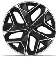
Zliatinové disky 19" LIMA (ZHT2) v sérii pre CROSS RIVOLI , voliteľná výbava pre TROCADERO CROSS