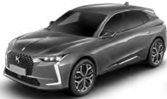
Sivá Platinium (M)