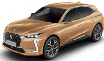
Zlatá Copper (M)