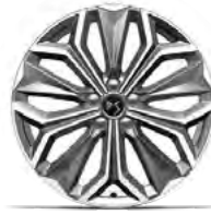
Zliatinové disky 19" FIRENZE (ZHT3) v sérii pre TROCADERO