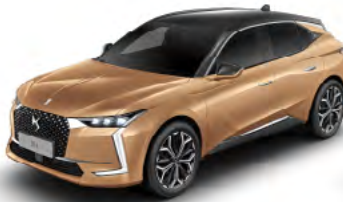
Zlatá Copper (M)