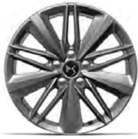
Zliatinové disky 17" ATHENES (ZH7S) v sérii pre Bastille+