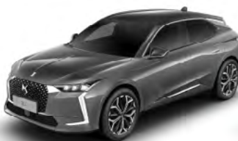
Sivá Platinium (M)