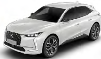
Biela Perleť (P)