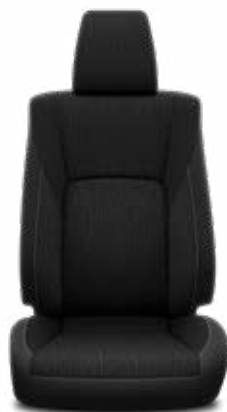
Čierna látka Štandard pre výbavu Active a Executive