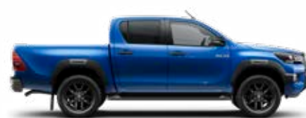
8X2 Modrá – vodná*