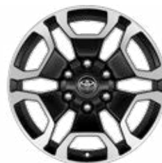
18" zliatinové disky dvojfarebné šedé brúsené Štandard pre Double Cab vo výbave Executive