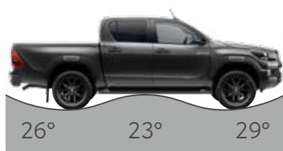
Zadný nájazdový uhol Prechodový uhol Predný nájazdový uhol