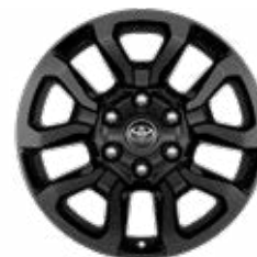
18" zliatinové disky čierne brúsené (6 lúčov) Štandard pre výbavu Invincible a Invincible Sport