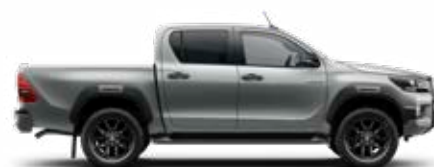
1D6 Strieborná – zirkónová*