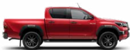
3T6 Červená – vulkanická*