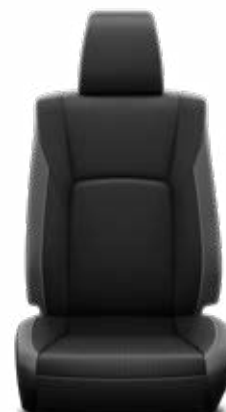
Čierna prírodná / syntetická koža Štandard pre výbavu Invincible a Invincible Sport