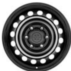
17" oceľové disky čierne Štandard pre Extra Cab a Double Cab s výbavou Base a Live