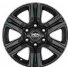
17" zliatinové disky (6 lúčov) Štandard pre Double Cab vo výbave Active