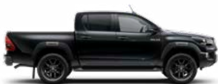
218 Čierna – klasická*