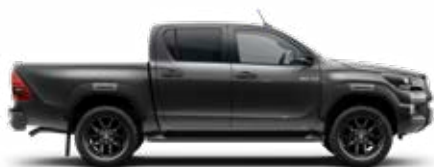
1G3 Sivá – popolavá*