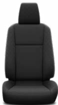
Čierna látka Štandard pre výbavu Live