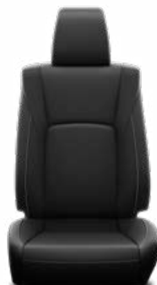
Čierna prírodná / syntetická koža Voliteľné v rámci paketu VIP