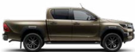
6X1 – Bronzovozelená – Jungle*