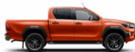
4R8 Oranžová – lávová*