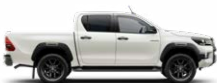
070 Biela – perleťová** (nie pre Single Cab)