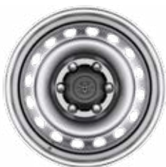
17" oceľové disky kolies strieborné Štandard pre Single Cab