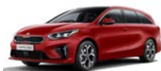
Infra Red (metalický lak)