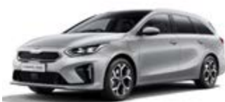
Sparkling Silver (metalický lak)