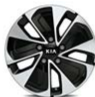
205/55R16-palcové disky kolies z ľahkých zliatin / Gold

DISKY KOLIES (disponibilné v závislosti od stupňa výbavy) >>