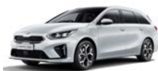
Deluxe White (metalický lak)