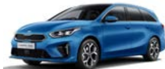
Blue Flame (metalický lak)