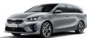
Lunar Silver (metalický lak)