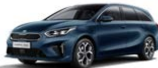
Cosmo Blue (metalický lak)