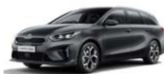
Penta Metal (metalický lak)