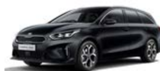
Black Pearl (metalický lak)

DISKY KOLIES (disponibilné v závislosti od stupňa výbavy) >>