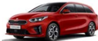
Track Red (nemetický lak)