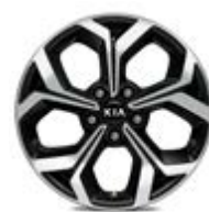
225/45R17-palcové disky kolies z ľahkých zliatin / Platinum