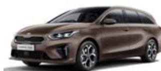
Cooper Stone (metalický lak)